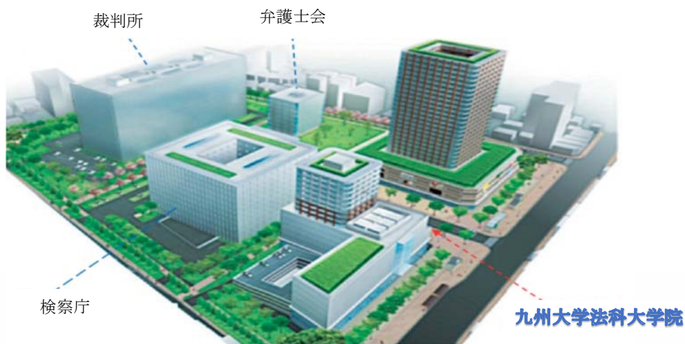
六本松九大跡地リーガル・パーク（愛称）イメージ図