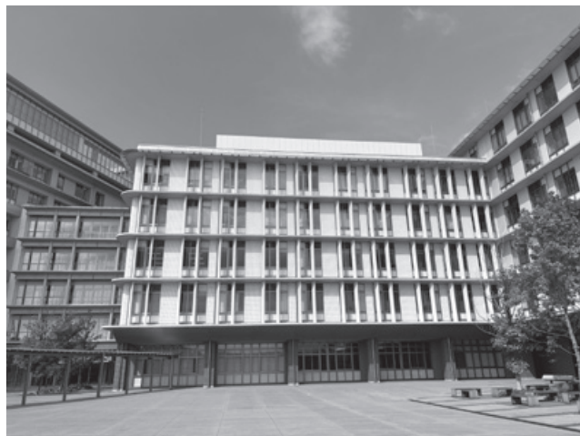
福岡市西区の伊都キャンパス。文系校舎は最後に完成した

号（2025年3月刊行予定）に掲載の予定です。掲載後程なくネット上にてPDFを公開する予定にしています。特に若い同窓会員の皆様には学生時代を思い出しつつ、また最近の法学研究院の状況について知って頂く縁として、御高覧を賜れますれば委員会一同これに過ぎる喜びはございません。よろしくお願い申し上げます。