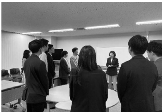
新入会員の自己紹介の様子(有楽町の九大オフィス)

恒例の新人歓迎会を令和6年4月20日(土)、有楽町の九大オフィスで開催しました。総勢14名の新人