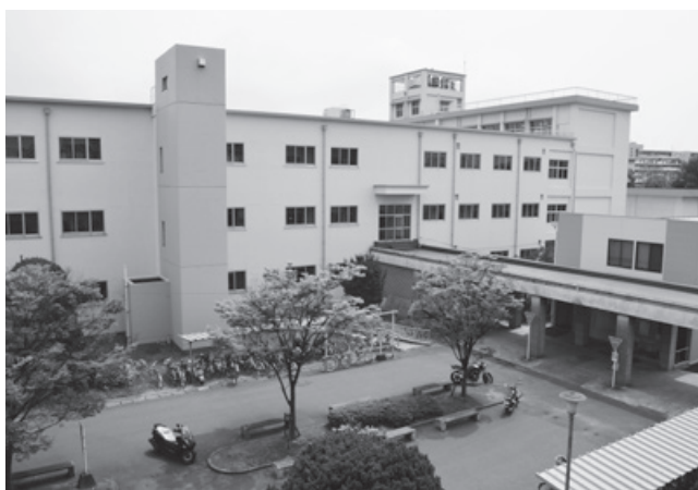
かつての学び舎だった箱崎キャンパスの文系校舎

1924年9月25日、勅令第224号によって、九州帝国大学内に法文学部が設置されることが発令されました。