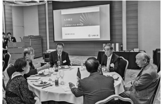
大いに盛り上がった広島支部同窓会