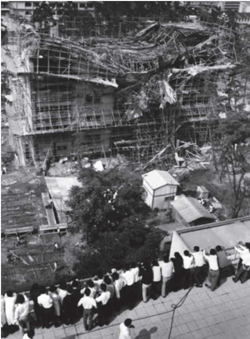
昭和43年6月、建設中の電算センターに墜落した米軍機のファン トム機

攻撃に端を発する太平洋戦争が続く。昭和20（1945）年8月15日の我が国の敗戦により、皮肉にも米国進駐軍の管制下で日本国憲法が施行され、民主主義が定着して行く時代となるが、我が国は日米安保条約を締結し、米国の傘下で平和を保っていた。ところが日米安保条約の改定期の昭和33年頃から、日本全国に安保闘争と称する学生運動が展開され、九大も板付基地撤去運動として活発化した学生運動が、昭和43（1968）年6月2日の米軍機ファントム大型電算機センター墜落を契機に先鋭化することとなる。その頃私は、九大法学部2年生で、大学の授業がない空白の時間を約1年間、柔道と登山三昧で過ごした。