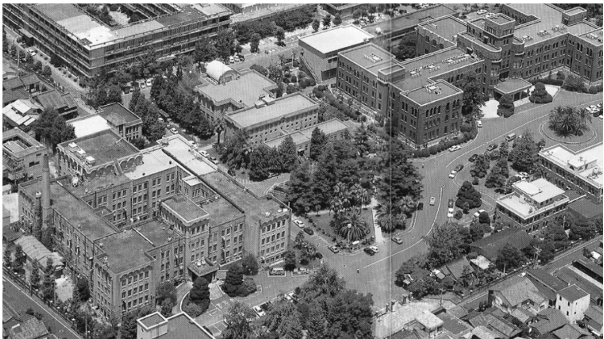
かつての箱崎キャンパス。左下の口の字型の建物が「法文学部」だった。右上の建物が大学本部（写真は1992年版の「九州大学法学部同窓会名簿」から）

縁というものは不思議なものです。九州大学法学部を出たことを誇りに思っております。