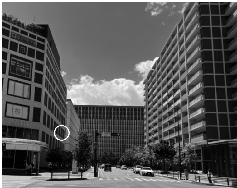
新しいエリアになった六本松リーガルパーク （丸部分が九州大学法科大学院）

（なお、九州大学法科大学院は、法学部との連携強化のため、2027年4月に、伊都キャンパスへ移転する予定です。）